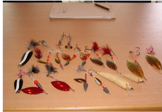
Praktisches Seminar Bau von Kunstköder & Zubehör 23. – 25. November 2012 im Kloster Untermarchtal