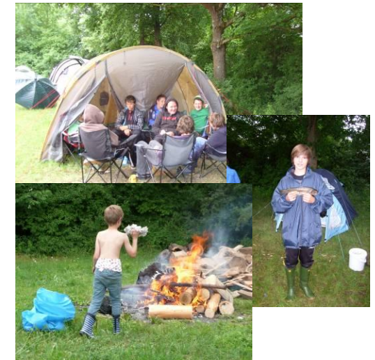
07. – 10. Juni 2012 in Kirchberg-Iller