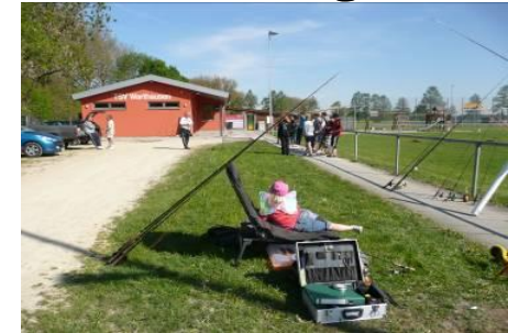
05. – 06. Mai 2012 in Warthausen